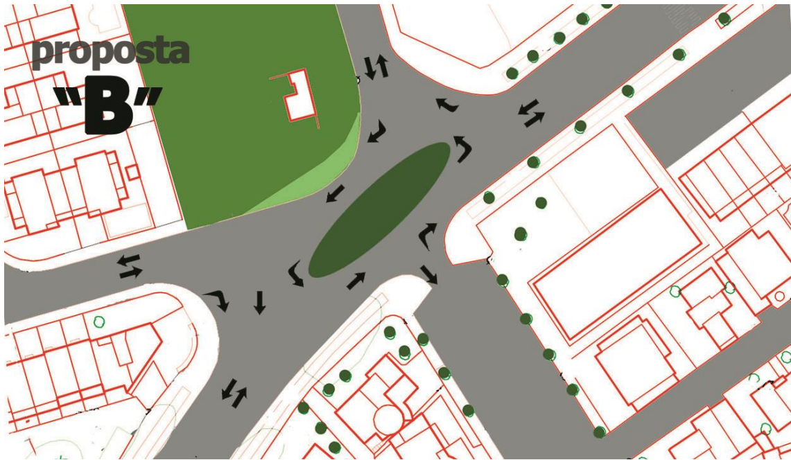
Cruïlla c. Puigmal, c. Tamariu, c. Marinada, accés Ilac Sant Maurici.

Els hi preguem que ho estudien amb detall i aprofitant la propera intervenció puguin oferir als veïns del sector Puigmal un accés segur i digna tal com el barri es mereix.