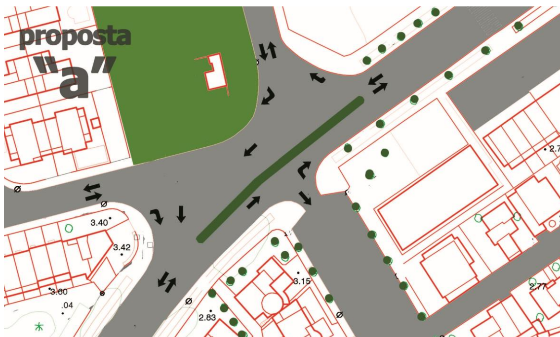
Cruïlla c. Puigmal, c. Tamariu, c. Marinada, accés Ilac Sant Maurici.

La nostre proposta, de fet son dos, la primera "a", es simplement instar-hi una divisió, podria funcionar bé però limitant la sortida del barri per anar cap a la rotonda. Potser fora bo reduint el transit de camions pel centre d'Empuriabrava, però també els vehicles lleugers es veurien afectats obligant-los a sortir per altres carrers.